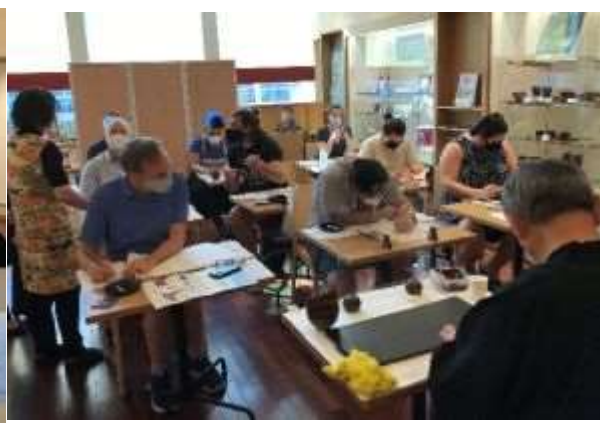
輪島塗の小物作り