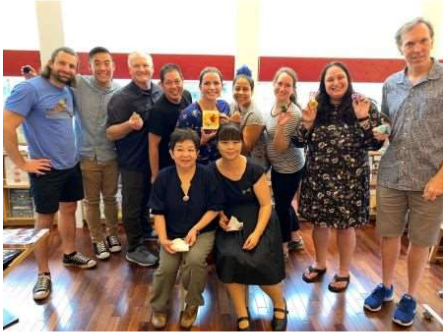
水引き体験 いしかわ百万石物語・江戸本店にて