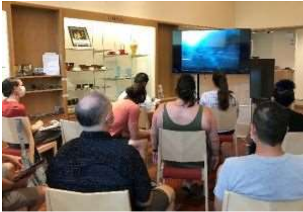
Learning Noto's Agehama-style salt-making method