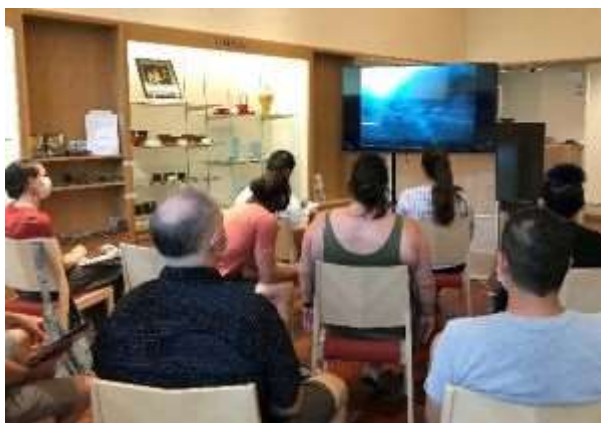
揚げ浜式製塩法を塩田からの中継で学ぶ