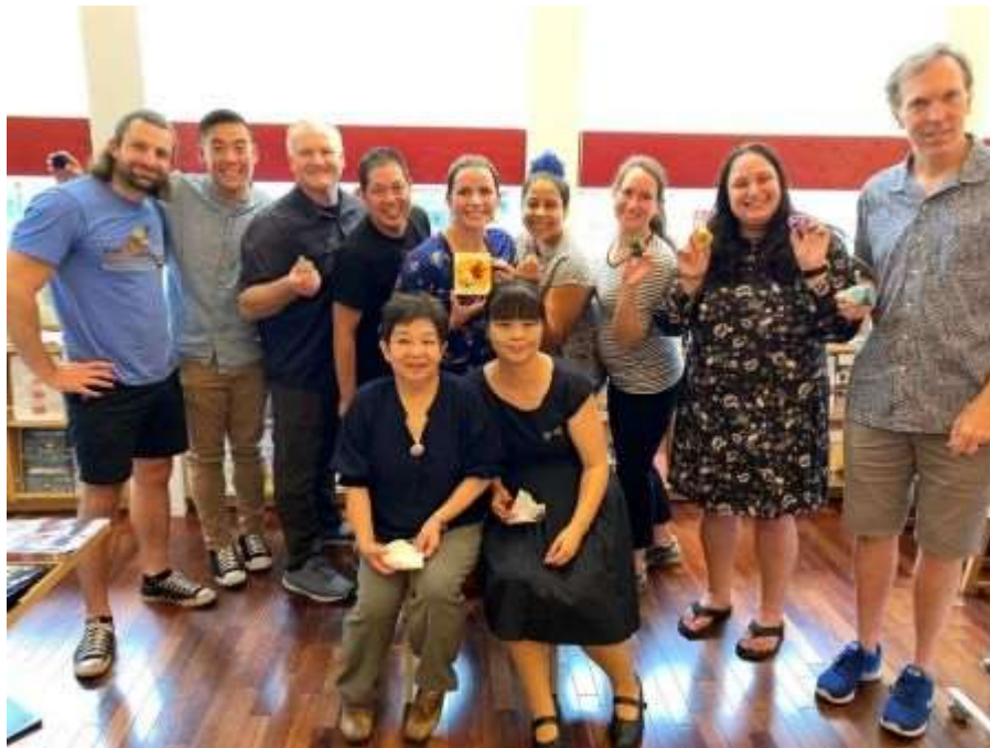
Mizuhiki craft experience at Ishikawa Local Specialty Shop

Pictures from interacting with host families online